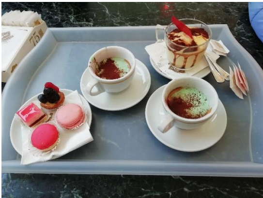
Slika 2: Kulinarika v padovi

Po končanem delu smo imeli prosti čas za raziskovanje kulturnih, zgodovinskih in geografskih značilnosti Padske nižine. Italijanska kulinarika je nam Slovencem blizu, vendar smo našli kar nekaj zadev, ki smo jih z veseljem degustirali.