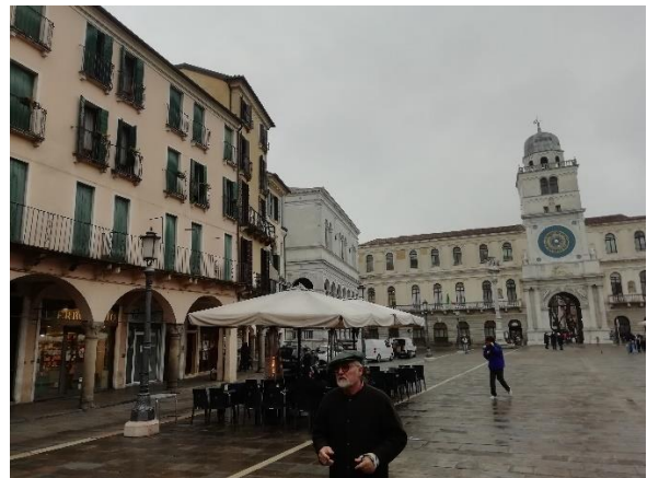
Slika 3: nekaj utrinkov Padove

Najbolj nam je ostal v spominu izlet v Benetke, kjer nas je osupnila veduta mesta na vodi in vse te veličastne zgradbe, ki te ne pustijo ravnodušnega. Raziskovali smo uličice in se pustili zapeljati čarobnosti Benetk.