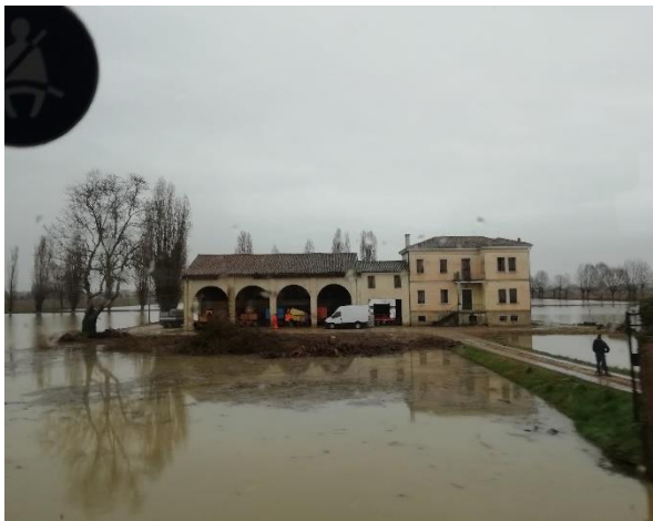
Slika 5: nesojen ogled Verone

Žal nam vreme vedno ni šlo na roko, saj si žal, zaradi poplav nismo ogledali Verone. Ogled Verone je en od mnogih razlogov, da se ponovno vrnemo v padsko nižino.