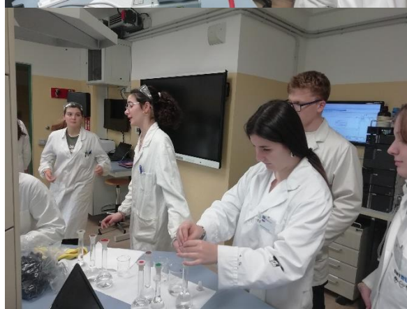
Slika 1: Ekipa iz Slovenije in delo v laboratoriju

Delo v dobro opremljenih laboratorijih je postala naša vsakodnevna praksa in dijaki so dobili možnost dela na aparaturah, ki jih naša šola ne premore. Sam potek dela je bil zasnovan zelo premišljeno, saj smo spoznavali delo na realnih vzorcih. Uporabljali smo plinsko