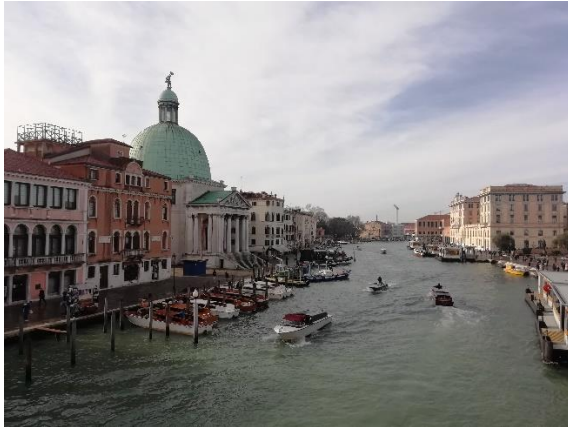
Slika 4: utrinki Benetk